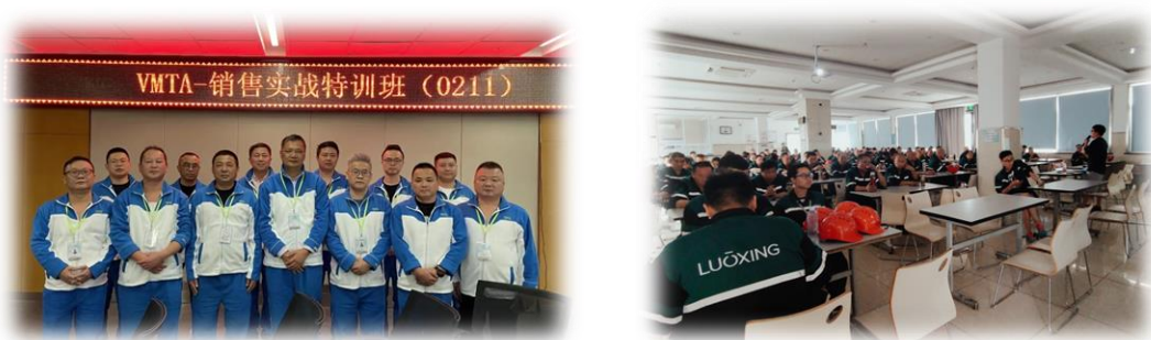
图 3.2-1 各类培训活动

公司将员工学习和发展视为“投资”，把创建学习型组织，营造全员学习的氛围作为公司长期发展战略的重要组成部分。随着公司规模扩大和全球化发展战略的实施，根据企业相关规定及各部门要求确定培训人员的需求情况。各部门负责人确定人员培训需求后经公司领导审批，相关部门每季度根据人员数量酌情进行培训计划的制定与实施。公司并成立了“罗星股份商学院”，见图 3.2-1 所示。