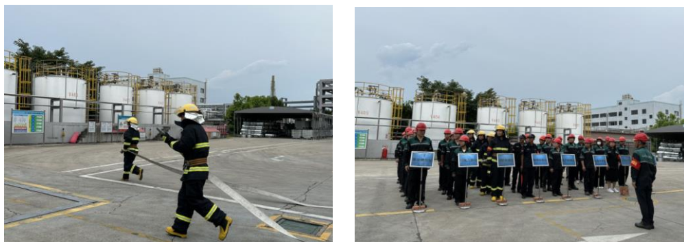
图 6.3-01 《化学品泄漏事故应急预案》演练现场

公司每年举行消防演练和各种灾害应急演练。公司制订了《配电房火灾、爆炸应急预案》等应急预案、《触电事件应急预案》、《重大设备故障应急预案》等应急处置方案等，对火灾、机械、触电等均有相应的应急措施，并成立了应急指挥中心和应急救援专业组。