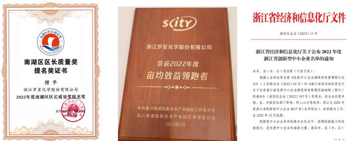
图 3.3-1 社会认可的证书（示例）

公司恪守商业道德，坚持诚信经营和公平竞争原则。公司从多年的经营实践中总结提炼的价值观就是“开拓创新、追求卓越、诚恳守信，共同发展”，并以此为准绳奉行不止，高层领导带头学习《公司法》、《产品质量法》、《环境保护法》、《劳动法》等法律法规培养对客户讲诚信，重合同，守信用；对社会讲诚信，守公德，行公益的行为准则。公司每年销售交易额翻倍增长，公司从不违约，也从不因为价格、质量、交货期、收付款等问题与客商发生过纠纷，深受国内外客户的信赖。为此，公司先后获得政府、客户颁发的 2022 年亩均效益领跑者、市级绿色工厂、嘉兴市标准创新型企业、省诚信民营企业、2022 年度区长质量奖提名证书、省级名牌产品、省著名商标、2022 年度浙江省创新型中小企业和南湖科技园区科技创新企业等荣誉，如图 3.3-1 所示：